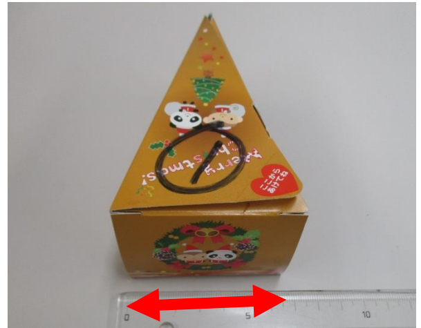
背面 横 6.5cm